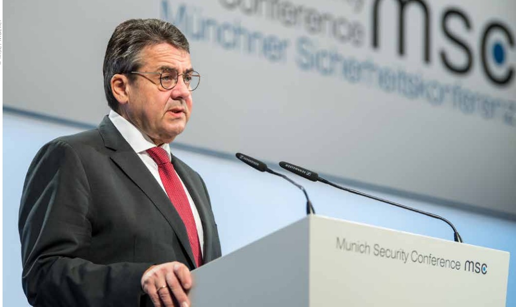
Demokratie vs. Autokratie? Gabriel auf der MSC 2018

Sie sind längst nicht zum globalen Standard geworden. Als unterschiedliche Systeme koexistieren im Großen und Ganzen die beiden Systemtypen heute in der internationalen Arena miteinander – ohne Kalte Kriege und die Welt verunsichernde Systemkonkurrenz. Folglich muss autoritärer Systemcharakter an sich nicht Anlass internationaler Spannungen sein. Solange ordnungspolitische Unterschiede nicht als Streitgegenstand in die zwischenstaatlichen Beziehungen getragen werden, sind sie keinen Anlass für internationale Konflikte. Es sei denn, die demokratische Seite delegitimiert und sanktioniert die andere als „Schurkenstaaten“ oder arbeitet aktiv daran, ihre Ordnung diesen Staaten, wie im Nahen und Mittleren Osten geschehen, gewaltsam aufzuoktroyieren. Das führte zu desaströsen Kriegen. Seitdem Demokratien „ regime change “ betreiben, wird deutlich, dass Demokratien keineswegs friedliches zwischenstaatliches Verhalten garantieren.